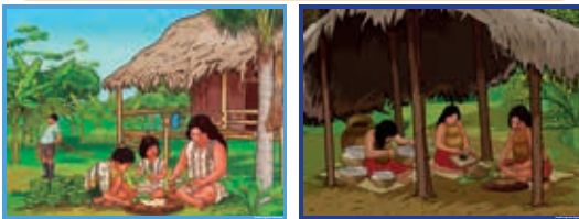
Láminas de pueblos amazónicos