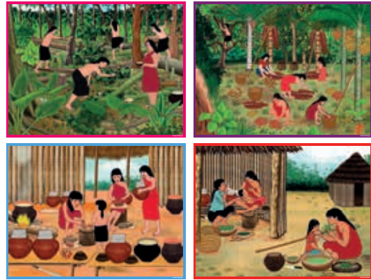
Pueblo originario Wampis