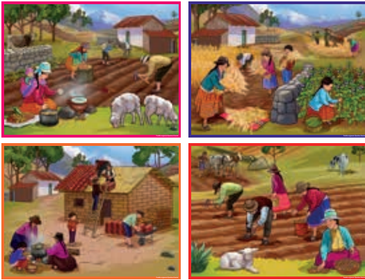
Pueblo Originario Quechua Central