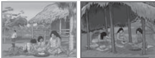
Láminas de pueblos amazónicos