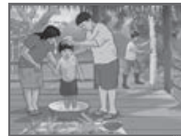
Lámina del pueblo afroperuano