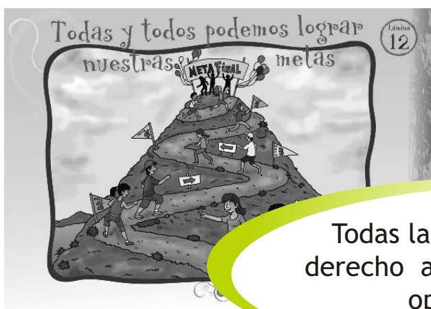
LÁMINA 12: TODAS Y TODOS PODEMOS LOGRAR NUESTRAS METAS

Todas las personas tenemos derecho a gozar de las mismas oportunidades.