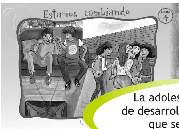
LÁMINA 4: ESTAMOS CAMBIANDO

La adolescencia es un proceso de desarrollo, cambio y autonomía que se vive con especial intensidad y alegría.