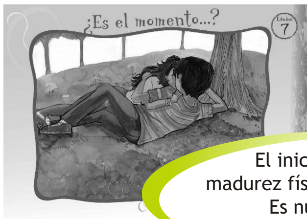
LÁMINA 7: ¿ES EL MOMENTO...?

El inicio sexual requiere madurez física, emocional y social. Es nuestra decisión y responsabilidad.