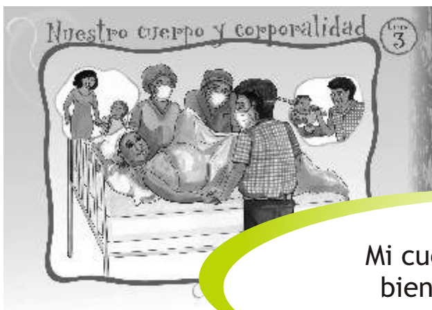
LÁMINA 3: NUESTRO CUERPO Y CORPORALIDAD

Mi cuerpo, fuente de bienestar y placer.