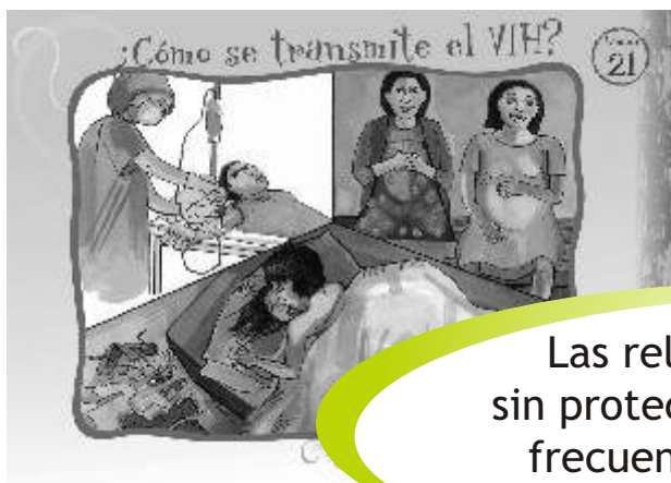
LÁMINA 21: ¿CÓMO SE TRANSMITE EL VIH?

Las relaciones sexuales sin protección son la vía más frecuente de transmisión del VIH.