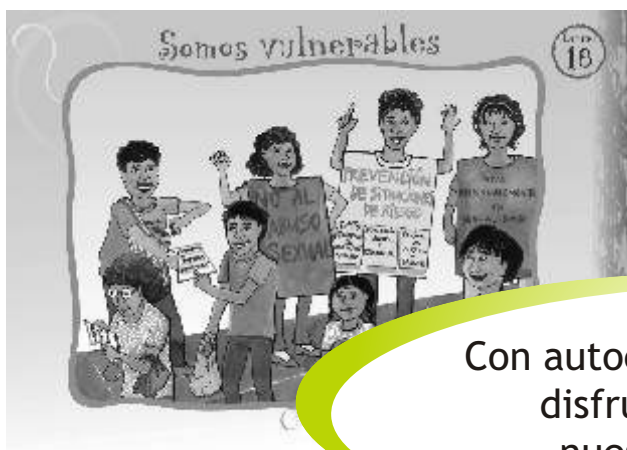
LÁMINA 18: SOMOS VULNERABLES

Con autocuidado y prevención disfrutamos sin riesgo nuestra sexualidad.