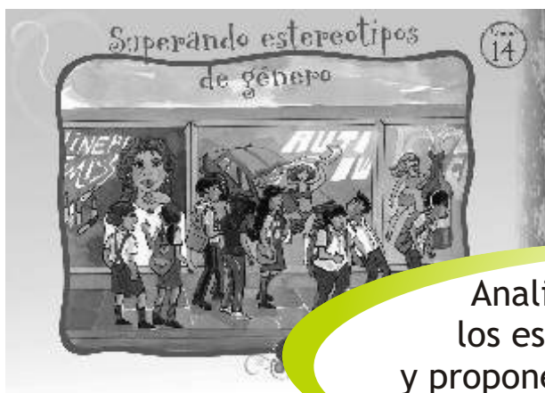
LÁMINA 14: SUPERANDO ESTEREOTIPOS DE GÉNERO

Analizamos críticamente los estereotipos de género y proponemos nuevos modelos de ser varones y ser mujeres.