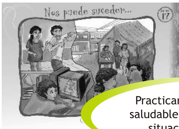
LÁMINA 17: NOS PUEDE SUCEDER...

Practicando estilos de vida saludable nos protegemos de situaciones de riesgo.