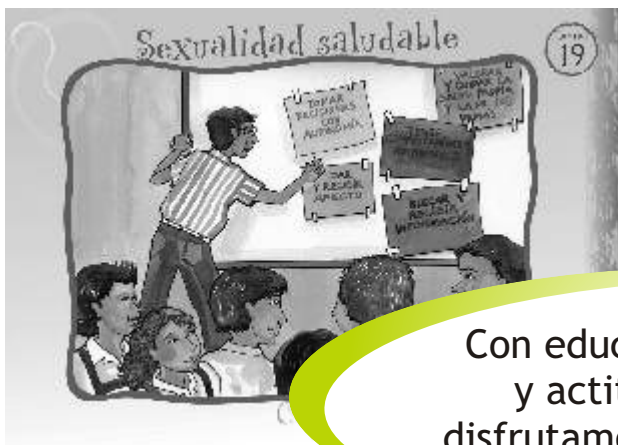
LÁMINA 19: SEXUALIDAD SALUDABLE

Con educación sexual integral y actitudes responsables disfrutamos plenamente nuestra sexualidad.