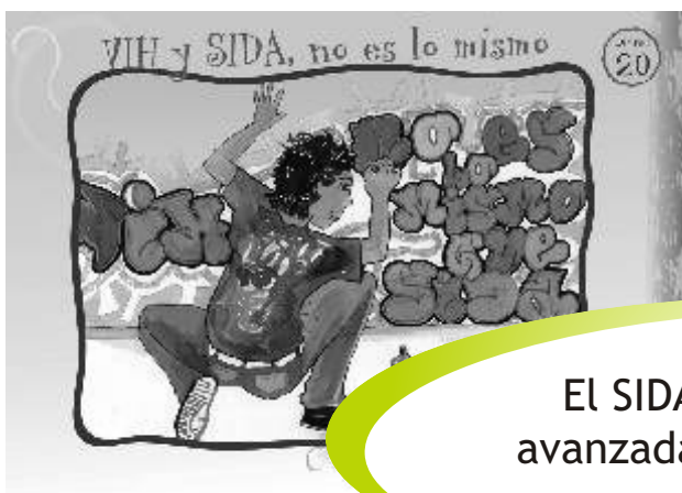
LÁMINA 20: VIH Y SIDA, NO ES LO MISMO

El SIDA, es la fase final y avanzada de la infección por VIH.