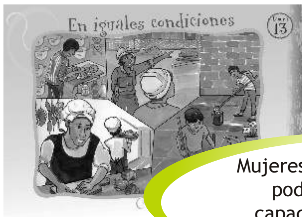
LÁMINA 13: EN IGUALES CONDICIONES

Mujeres y hombres por igual podemos desarrollar capacidades y demostrar habilidades.