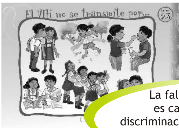
LÁMINA 23 : EL VIH NO SE TRANSMITE POR ...

La falta de información es causa de estigma y discriminación de las personas que viven con VIH y SIDA.