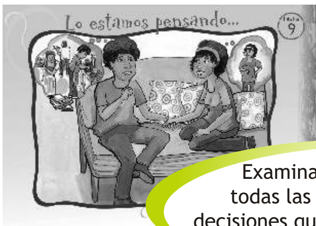
LÁMINA 9: LO ESTAMOS PENSANDO...

Examinamos críticamente todas las implicancias de las decisiones que tomamos priorizando nuestro plan de vida.