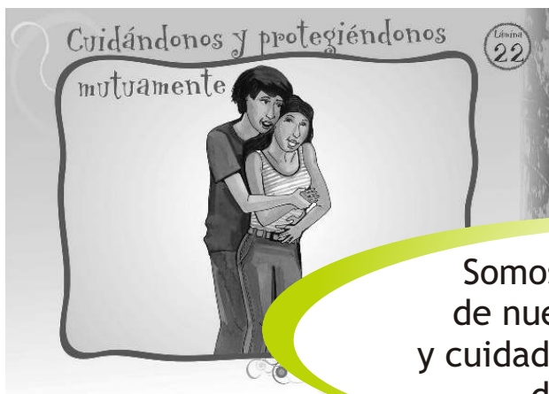
LÁMINA 22: CUIDÁNDONOS Y PROTEGIÉNDONOS MUTUAMENTE

Somos agentes activos de nuestro autocuidado y cuidado de la salud sexual de los demás.