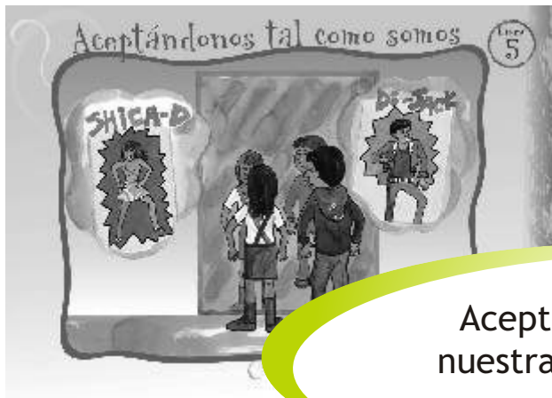
LÁMINA 5: ACEPTÁNDONOS TAL COMO SOMOS

Aceptamos y valoramos nuestra imagen corporal e identidad.