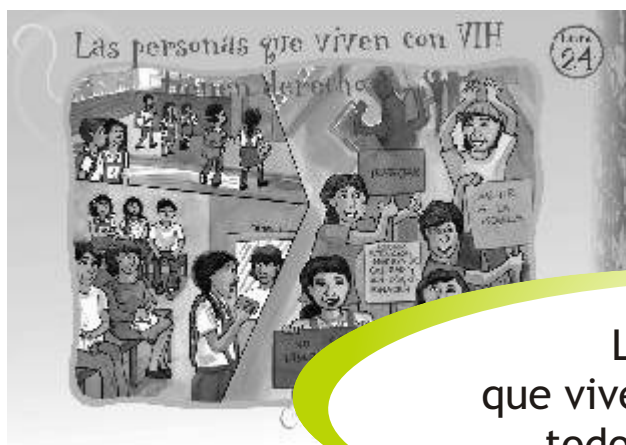
LÁMINA 24 : LAS PERSONAS QUE VIVEN CON VIH TIENEN DERECHO A...

Las personas que viven con VIH ejercen todos sus derechos.