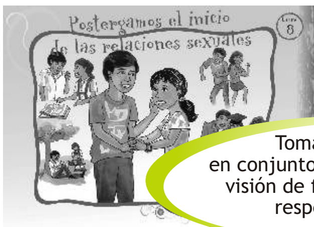
LÁMINA 8: POSTERGAMOS EL INICIO DE LAS RELACIONES SEXUALES

Tomamos decisiones en conjunto, considerando nuestra visión de futuro, plan de vida y respetando nuestros acuerdos.