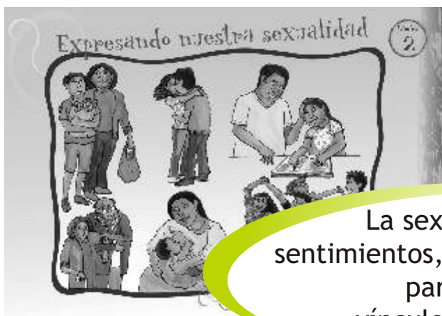
LÁMINA 2: EXPRESANDO NUESTRA SEXUALIDAD

La sexualidad expresa sentimientos, afectos y la capacidad para establecer vínculos con los demás.