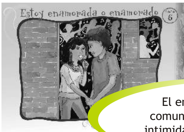
LÁMINA 6: ESTOY ENAMORADA O ENAMORADO

El enamoramiento es comunicación, confianza, intimidad, ternura y placer.