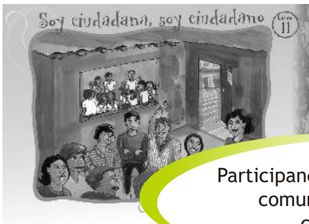
LÁMINA 11: SOY CIUDADANA, SOY CIUDADANO

Participando y opinando en mi comunidad ejerzo mi ciudadanía.