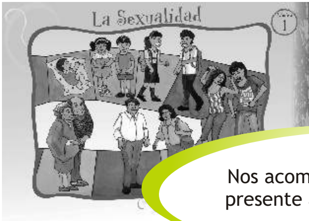
LÁMINA 1: LA SEXUALIDAD

Nos acompaña siempre y está presente a lo largo de la vida.