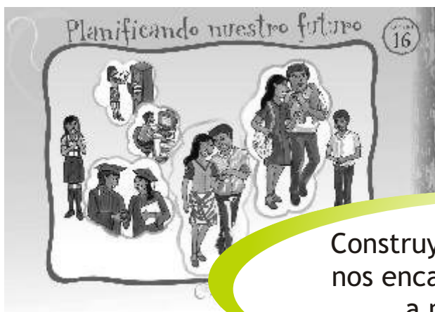
LÁMINA 16: PLANIFICANDO NUESTRO FUTURO

Construyendo un plan de vida nos encaminamos con acierto a nuestras metas.