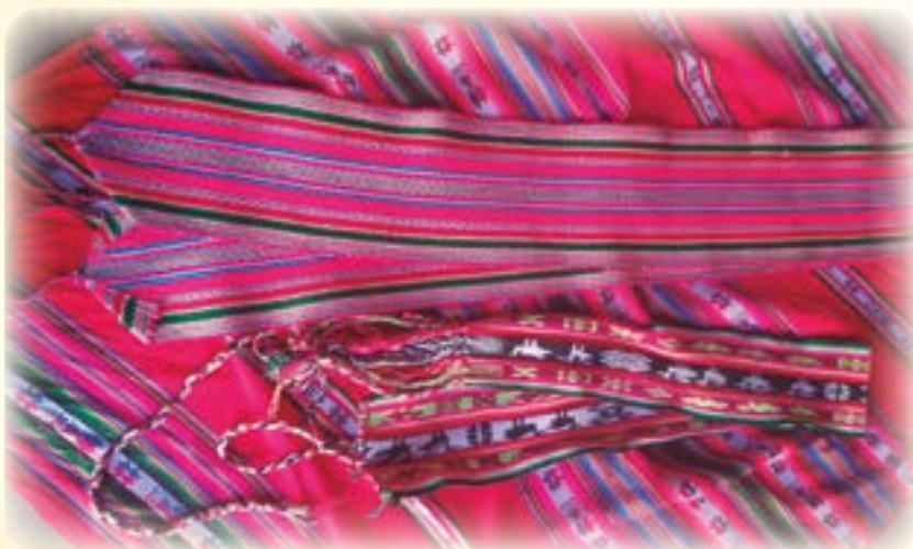
Jach'a jisk'a wak'ampi