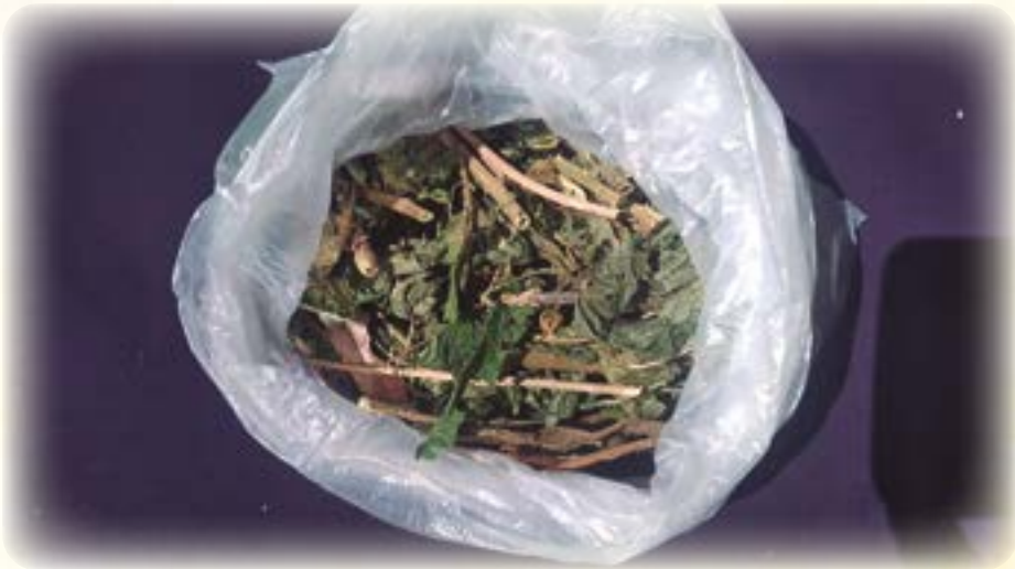
Jiruntiya. Junq'ichjata usunakwa qullirixa.