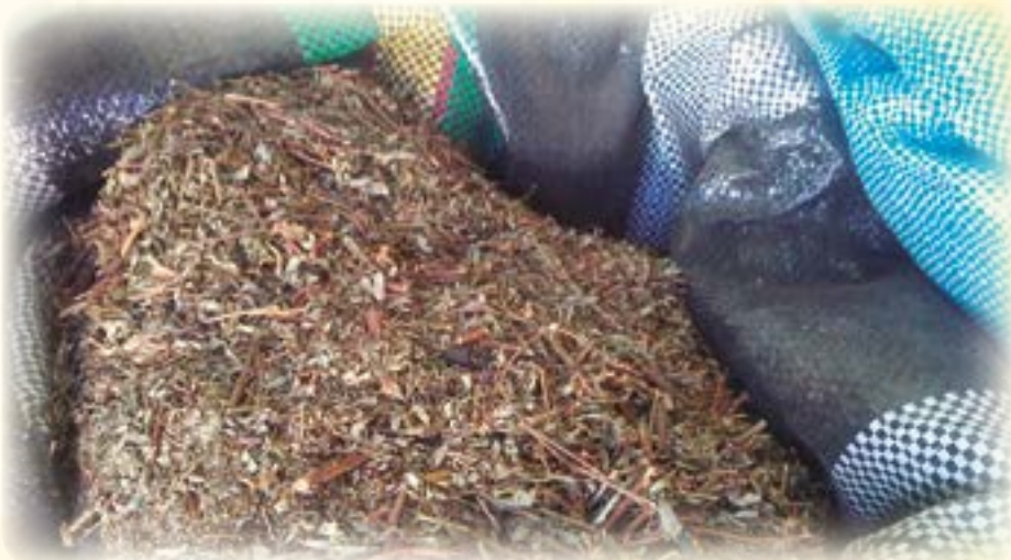
Qala ch'axiri qulla. Ukaxa puraka tankiri usutaki jani ukaxa muymura qullañatakisa wakisiwa.