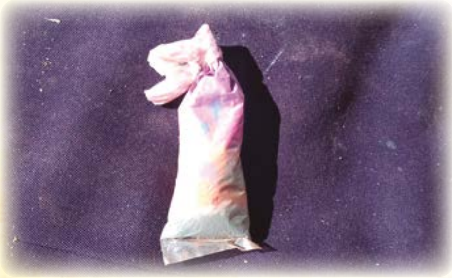
Paya tunka siwaryu.

payani siwaryumpi uskuntatawa umayapxixa, wari wilasa umayapxarakiwa, qhaxya qalasa t'unsuta umapxarakiriwa.