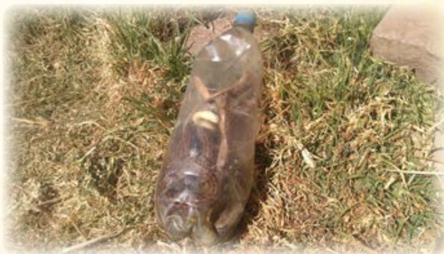
Asiru alkula t'amachata

Uka usuxa umana sinti sarnaqata ukhamasa thayampi kayunaka thaysuyasthana ukathsa churasiraki ukhamasa janiraki wali manq'anaka maq'thanti ukathsa churasirakiwa. Uka usumpixa kayu manqhina punkitatiriwa ukathwa kayuxa t'ijisixa sapxarakiwa, qullasiñatakixa waliwa qariwa, qariwaxa piqsuwsina chhuxumpi junt'uchañawa ukampiwa qunquritha q'ipichsusifña, iwija junt'u wanusa walirakiwa kunawsatixa lupi wali wanuri lupxantki ukjawa kayuxa wanu taypiru ayantaña. Jawirana, qutana tuyuñasa walirakiwa ukhamasa uka usaxa laq'ampiwa katjasirixa sapxarakiwa ukathwa laq'aru aytaña.