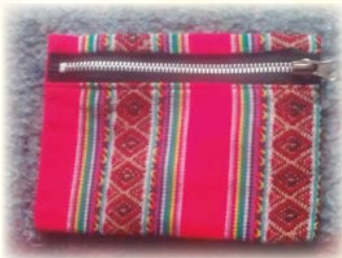
Qullqi imaña p'itata