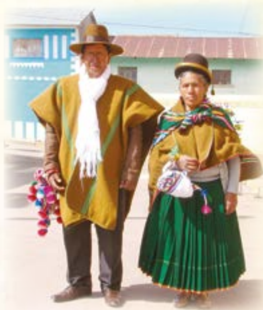
Nuwala punchuni, nuwala phullini tinintinaka