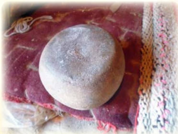
Muruq'u iyaña qala