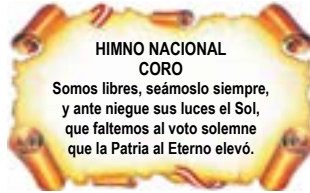
CORO DEL HIMNO NACIONAL