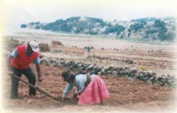
Uysumpi ch'uqi satasipki

Ch'awa. Yapu wakichañatakixa ch'awaxa waljawa munasixa, ukampipuniwa jach'a ch'ampanaksa, khulanaksa t'uñjañaxa ukhamasa qhullita taypinakana uka ch'awampipuniwa k'utjañaxa, jawq'akiptañaxa suma aquptañataki yapu jani khulararañapataki. Uka ch'awaxa sinti nayraxa qalata maya lawaru waka lip'ichita yawrinkhampi ch'uqantatanwa, jichhürunanaxa yaqhipanakaxa jiruta lawaru uchatarakiwa.