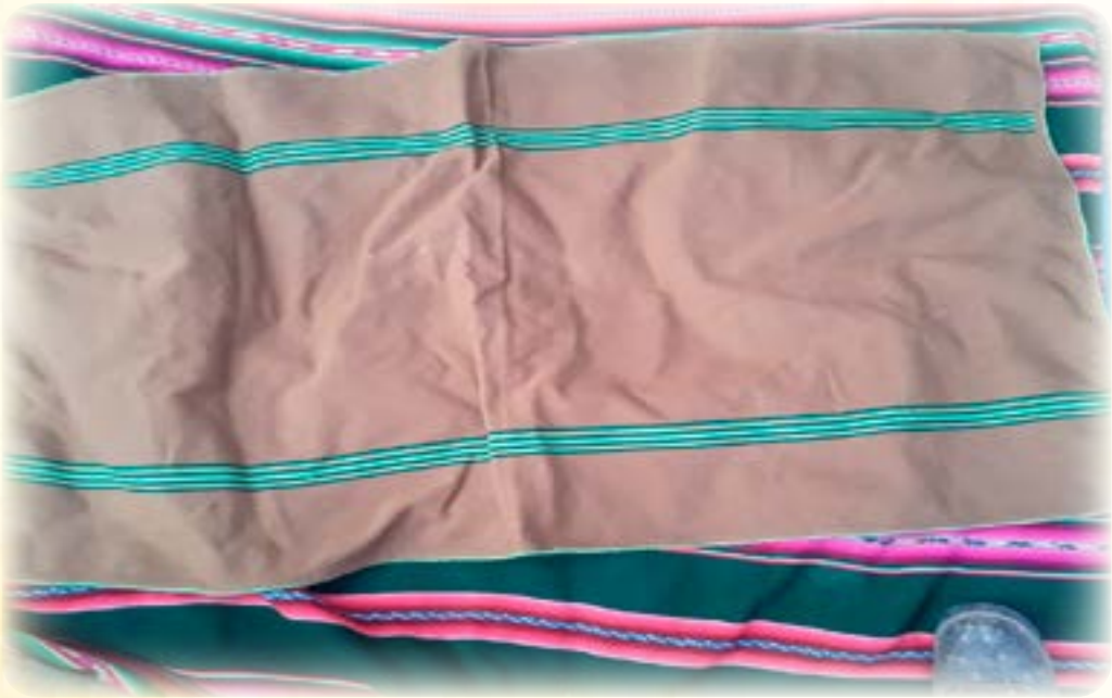
Sawukipata phullu-sillkuni phullu