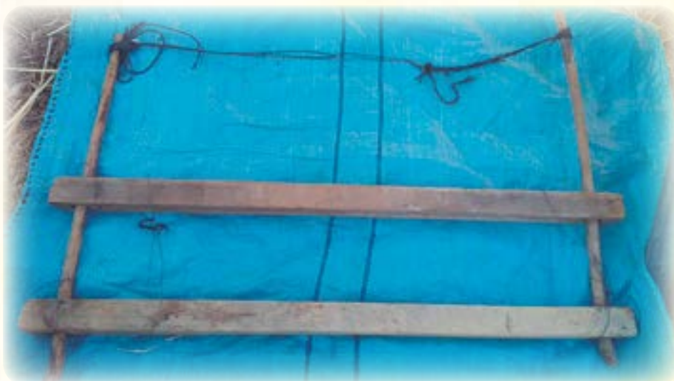
Illawa jawq'kataña (kaja)