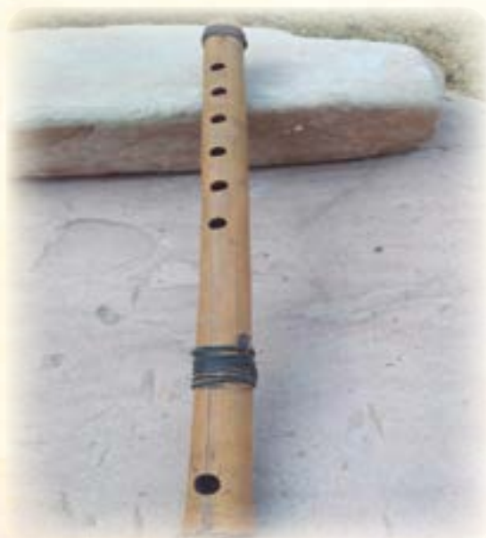
Qina qina pinkillu