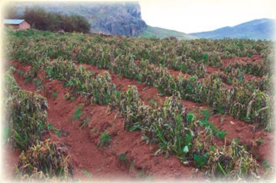
Juyphina katuta yapu

Jiwaso jaqinakaxa qhanrakwa amuyapxi kunapachasa juyphixa purintaspa ukatakixa jupanakaxa niya jayp'uchiqraru pankatayanaka walja chhuknuqiri, jamach'inaka tama tama aynuqiri uta jak'anakana, ch'isi thaya thayt'aniri ukanakwa uñch'ukipxarakixa.