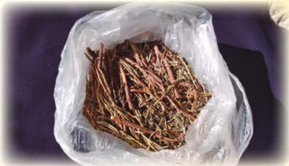
Rumiru. Usuqasiri warminakawa ukampi jarisiñapa, junt'u usunakatakisa walirakiwa ukhamasa kayu t'ukunakasa apaqasirakiwa.