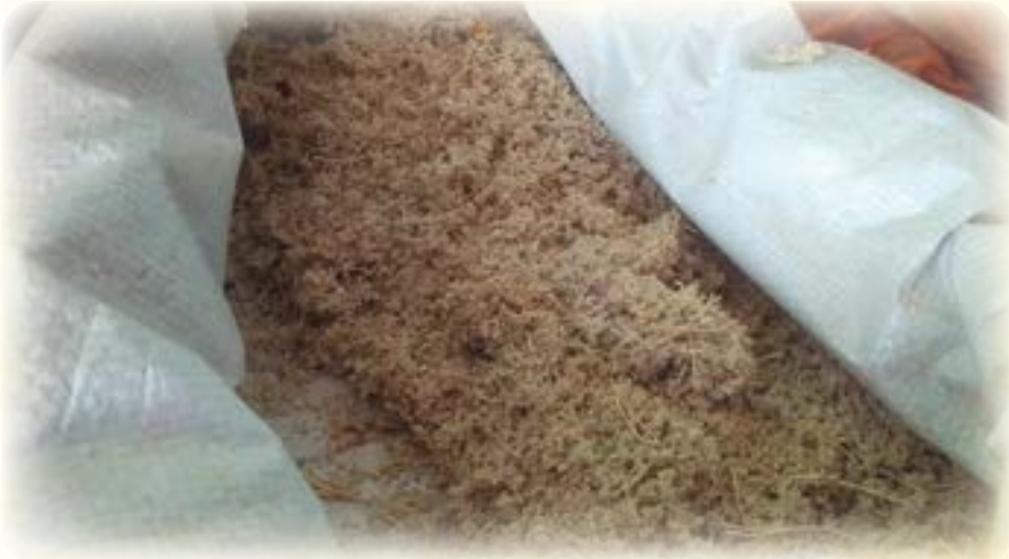
Jank'u t'ika. Mayrisa, yaq'allachi junq'ita qullañatakiwa walirakixa.