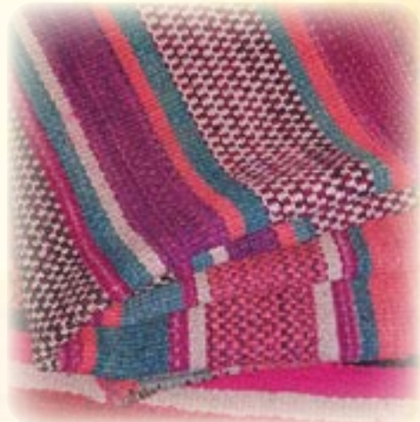
Jani saltani chusinaka