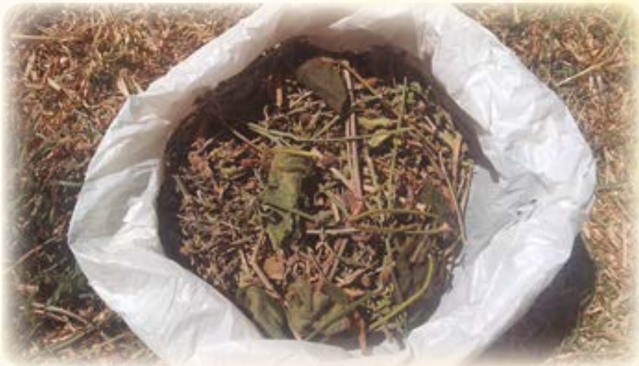
Tikili tikili. Ukaxa junq'ichjata usunakwa qullirixa.