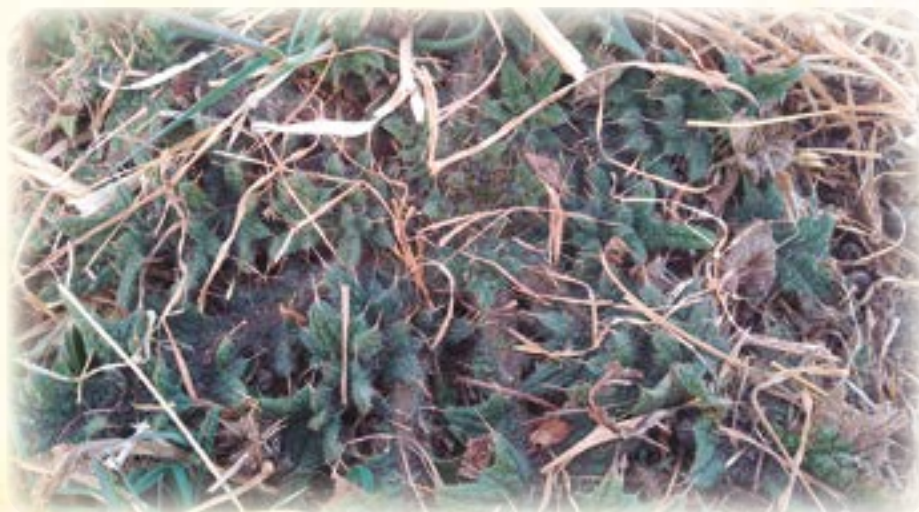
Junt'u usu qullaña qura