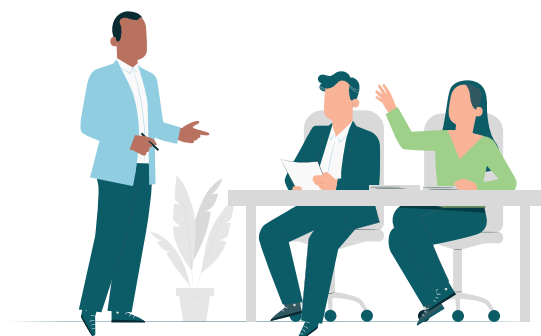
Gráfico 1 Compromisos de Gestión Escolar de resultados y de condiciones

para los CGE 3, 4 y 5 permiten avanzar en el cumplimiento de las condiciones para el funcionamiento de la IE, según las características y los recursos con los que cuenta.