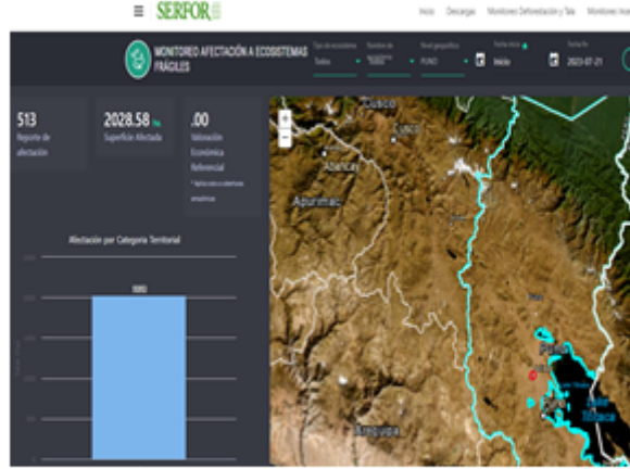
Imagen N° 2: Captura de pantalla del Sistema de Monitoreo de Ecosistemas Frágiles del Servicio Nacional Forestal y de Fauna Silvestre por el Estado - SERFOR.