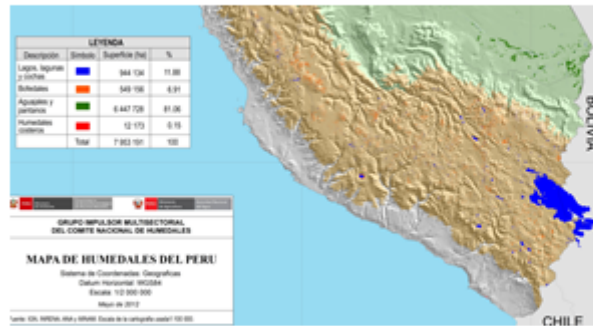
Imagen N° 4: Captura de Pantalla del análisis de superposición realizado en el Mapa de Humedales del Perú (Sitios Ramsar)