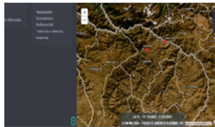
Imagen N° 5: Captura de pantalla del Sistema de Monitoreo de Ecosistemas Frágiles del Servicio Nacional Forestal y de Fauna Silvestre por el Estado - SERFOR.

Sistema de consulta en el Sistema de Monitoreo de Ecosistemas Frágiles del Servicio Nacional Forestal y de Fauna Silvestre al 02.08.2023 (Se adjunta detalle en el expediente administrativo a folio 20 (anverso))