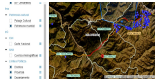
Imagen N° 7: Captura de pantalla del Sistema de Información Geográfica de Arqueología – SIGDA Ministerio de Cultura.

Fuente: https://sigda.cultura.gob.pe/ Sistema de consulta en el Sistema de información Geográfica de Arqueología al 0.2.08.2023 (Se adjunta detalle en el expediente administrativo a folio 22 (anverso)).