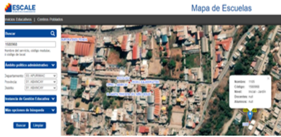
Imagen N° 02 Institución educativa N° 1105 Santa Isabel