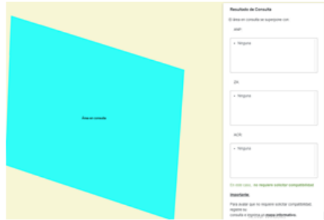
Imagen N° 01 Institución educativa N° 812 San Juan de Dios