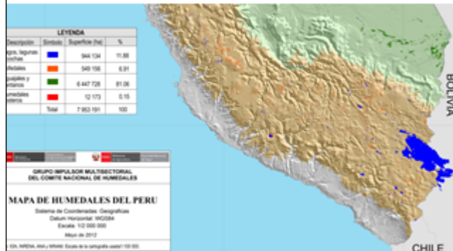
Imagen N° 3: Captura de Pantalla del análisis de superposición realizado en el Mapa de Humedales del Perú (Sitios Ramsar)