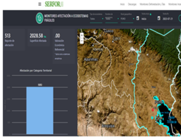
Imagen N° 2: Captura de pantalla del Sistema de Monitoreo de Ecosistemas Frágiles del Servicio Nacional Forestal y de Fauna Silvestre por el Estado - SERFOR.